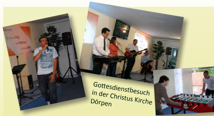
Gottesdienstbesuch in der Christus Kirche Dörpen

Zum Projekthof können Männer ab 18 Jahren kommen, die dazu bereit sind, mit Gottes Hilfe ihr Leben neu auszurichten und zu stabilisieren. Kostenträger sind nicht nötig. Der Hof finanziert sich durch Spenden, Eigenanteile der Klienten für Miete und Verpflegung, und Auftragsarbeiten.